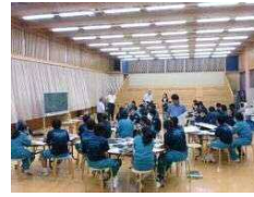
人数を増やしながらかし合い