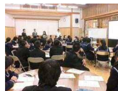
放射線の人体への影響と食の安全確保の取り組み紹介