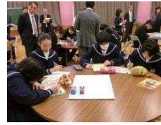
食の安全・安心の観点より「内部被ばくの防止」について