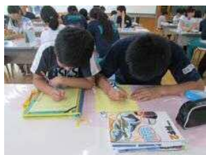
小中のペアで予想