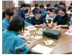
放射線の種類と性質