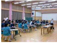
外部講師を招いての授業

放射線出前講座：平成24年 9月7日(金) 第3, 4校時 中2、中3交流 第5, 6校時 小6、中1交流