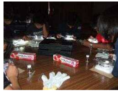
距離 グループごとに学習のまとめ