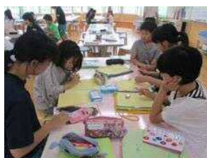
測定値の平均を中学生が説明